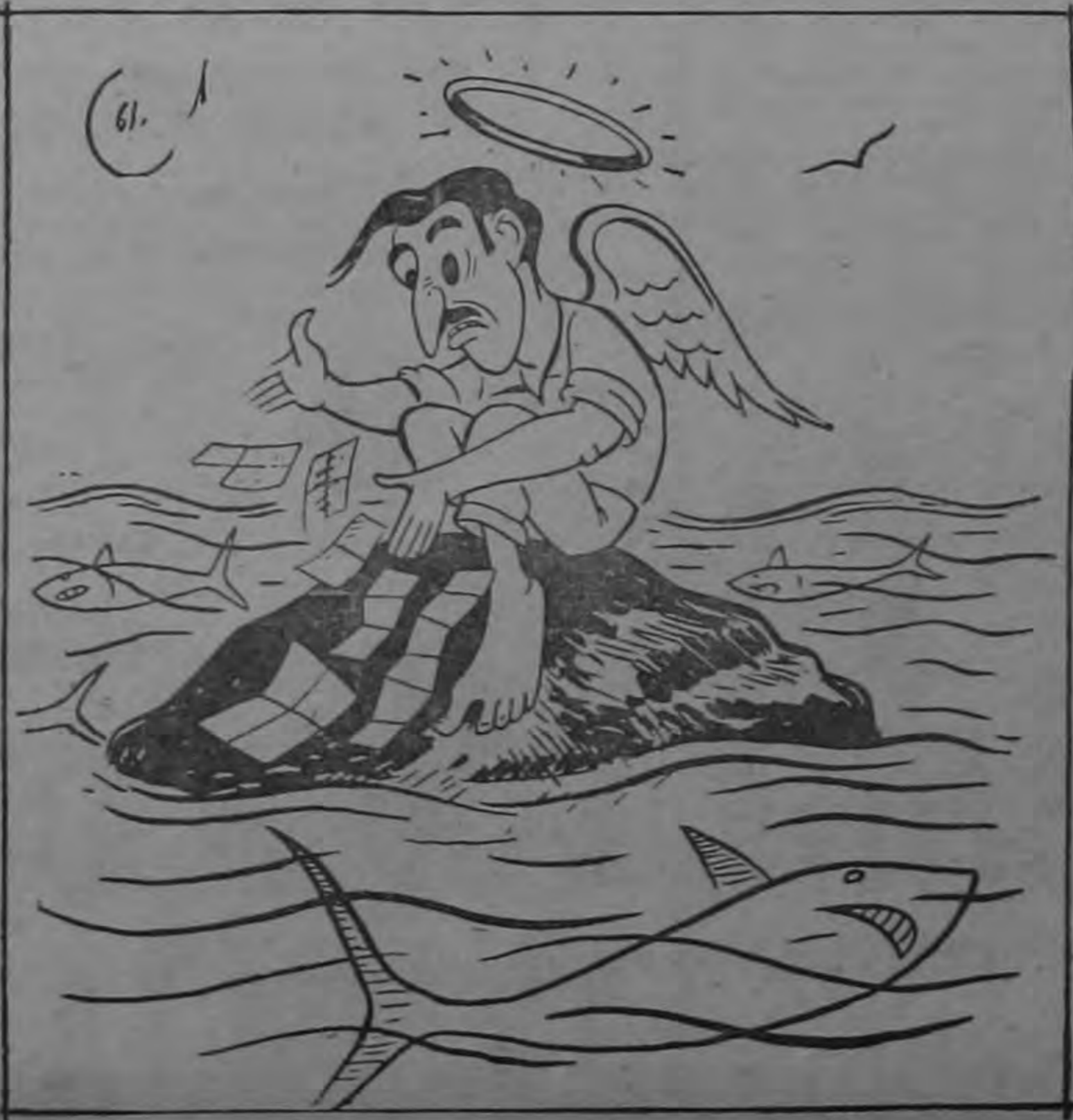
pero queda el monopolio de los ilusos, que es la legión de los perdedores...